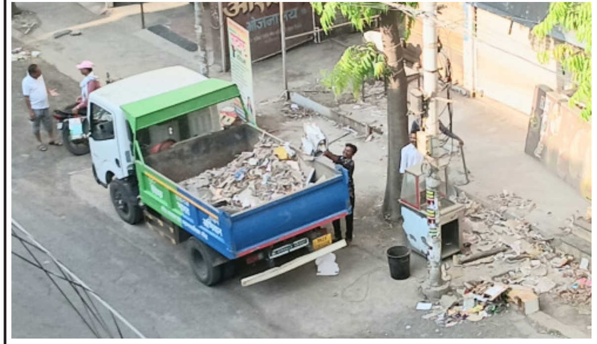
नांदेड शहरातील श्यामनगर भागात रस्त्यावरील कचरा वाहनात जमा न करता कंत्राटी सफाई कर्मचारी हे खाजगी इमारतीचे बांधकाम पाडलेले साहित्य वाहनात टाकुन घेवून जातांना दिसत आहेत.