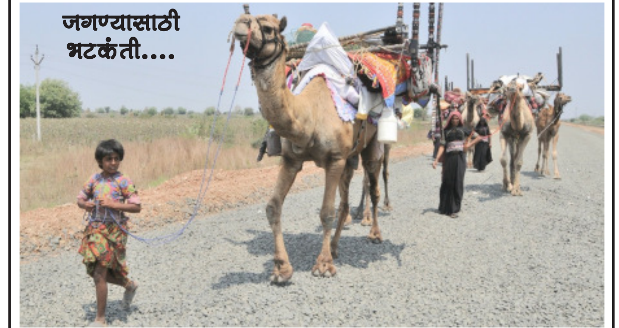
संसाराचे ओझे उंटोच्या पाठीवर लादून रखरखत्या रस्त्यावरून चालणारा भटक्या समाजाचा प्रवास जीवनाच्या संघर्षाची जाणीव करून देतो. डोक्यावर कडक ऊन, पायाखाली गरम रस्ता आणि उद्याच्या शोधात सुरु असलेली त्यांची अखंड भटकंती मन हेलावून टाकते.