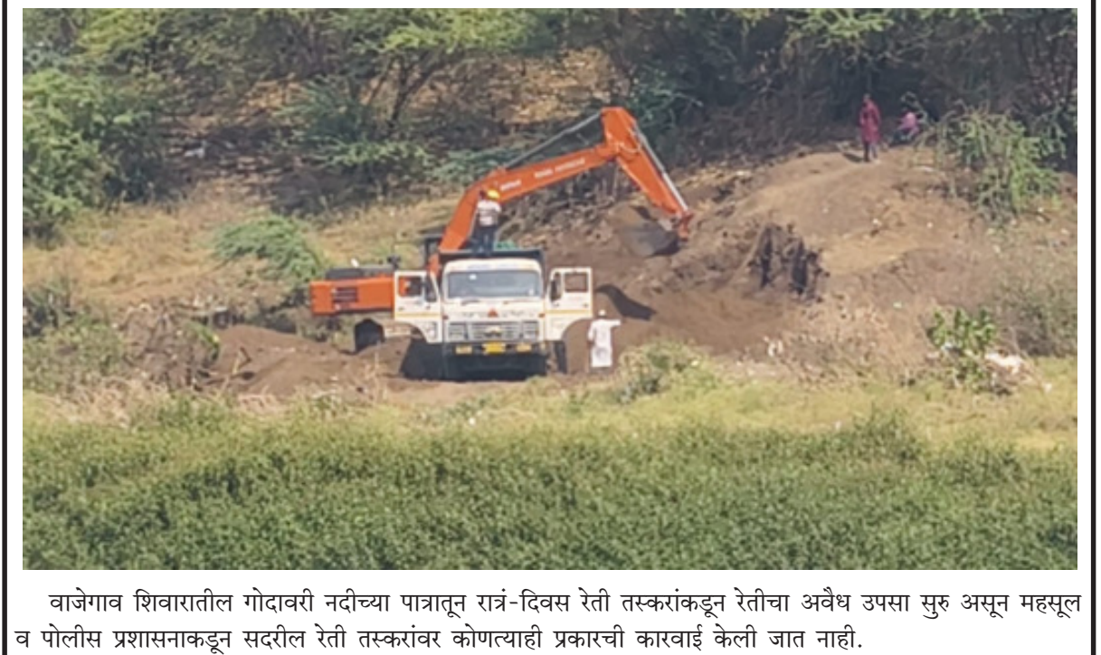
वाजेगाव शिवारातील गोदावरी नदीच्या पात्रातून रात्र-दिवस रेंती तस्करांकडून रेंतीचा अवैध उपसा सुरू असून महसूल व पोलीस प्रशासनाकडून सदरील रेंती तस्करांवर कोणत्याही प्रकारची कारवाई केली जात नाही.