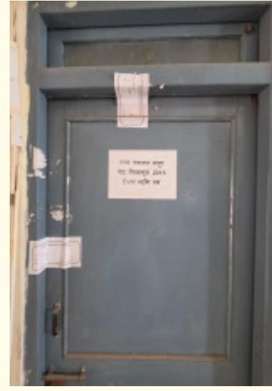
निर्णय प्रलंबित आहे. विशेष