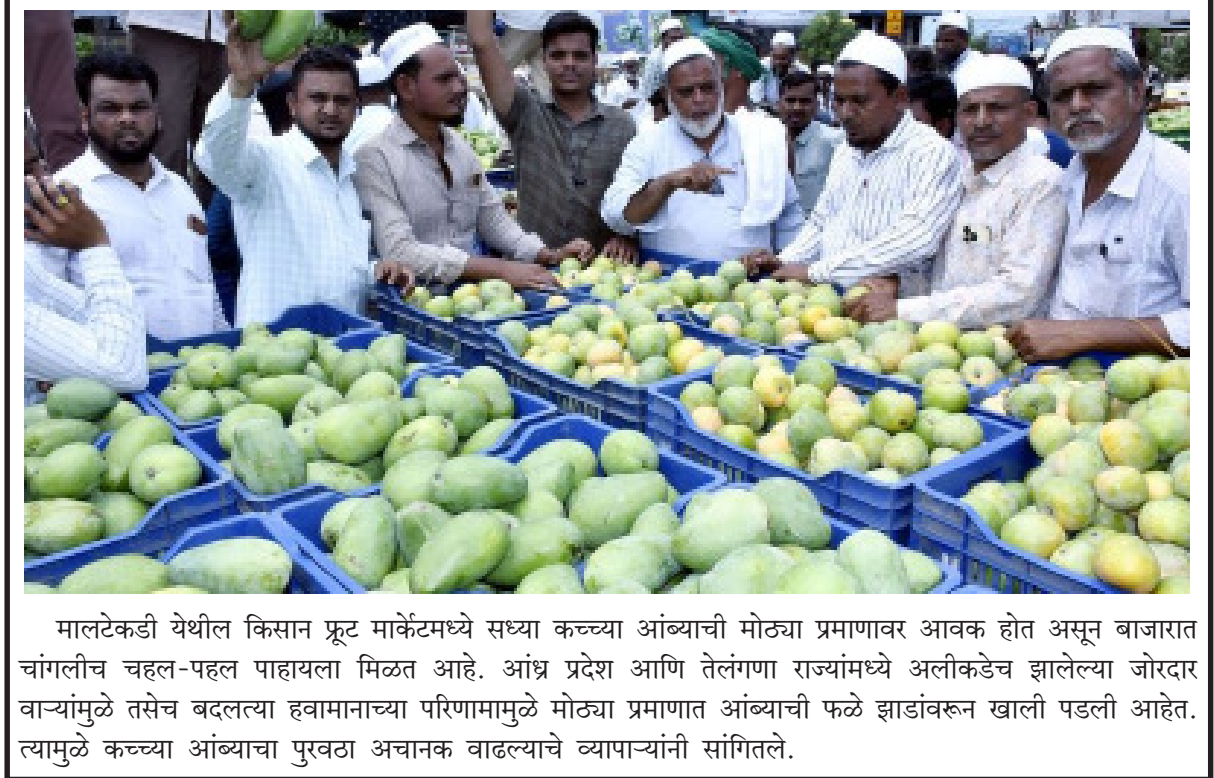
मालटेकडी येथील किसान फ्रूट मार्केटमध्ये सध्या कच्च्या आंब्याची मोठ्या प्रमाणावर आवक होत असून बाजारत चांगलीच चहल-पहल पाहायला मिळत आहे. आंध्र प्रदेश आणि तेलंगणा राज्यांमध्ये अलीकडेच झालेल्या जोरदार वाऱ्यांमुळे तसेच बदलत्या हवामानाच्या परिणामामुळे मोठ्या प्रमाणात आंब्याची फळे झाडांवरून खाली पडली आहेत. त्यामुळे कच्च्या आंब्याचा पुरवठा अचानक वाढल्याचे व्यापाऱ्यांनी सांगितले.