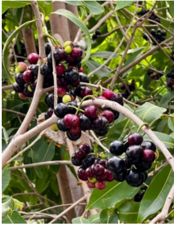
यावर्षी अनेक भागांमध्ये जांभूळ (Syzygium cumini) वृक्षांना मोठ्या प्रमाणावर फळधारणा झाल्याचे दिसून येत आहे. ग्रामीण भागात अशी एक समजूत प्रचलित आहे की, जांभूळाला भरपूर फळे आली तर पुढील वर्षी दुष्काळ पडतो. मात्र, या समजुतीकडे