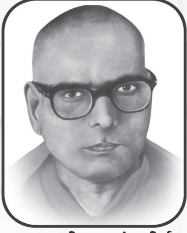
पूज्य स्वामी रामानंद तीर्थ संस्थापक अध्यक्ष