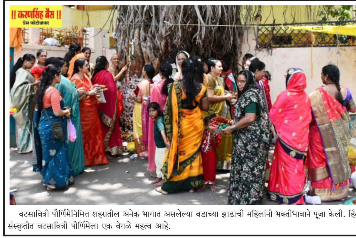
वटसावित्री पौर्णिमेनिमित्त शहरातील अनेक भागात असलेल्या वडाच्या झाडाची महिलांनी भक्तीभावाने पूजा केली. हिंदू संस्कृतीत वटसावित्री पौर्णिमेला एक वेगळे महत्त्व आहे.