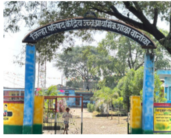
अतिरिक्त शिक्षकांचे समायोजन करावे आणि शाळांमधील अध्यापन सुरळीत ठेवण्यासाठी पर्यायी व्यवस्था करावी, अशी मागणी पालक, ग्रामस्थ व शिक्षणप्रेमींनी प्रशासनाकडे केली आहे.

छेद देणारी असून गावकऱ्यांमध्ये तीव्र नाराजी आहे. शिक्षण समितीचे सदस्य व पालकांनी शिक्षक बदली प्रक्रियेत झालेल्या नियोजनाच्या जुटींवर प्रश्नचिन्ह उपस्थित केले आहे. आंतरजिल्हा बदलीने शिक्षकांना कार्यमुक्त करण्यापूर्वी रिक्त जागा भरल्या असल्या, तर ही वेळ आली नसती, असे त्यांचे म्हणणे आहे. सध्या एका शिक्षकाला अनेक वर्गांचा भार सांभाळावा लागत असल्याने काही वर्गांना नियमित अध्यापन मिळत नाही. अशीच परिस्थिती तालुक्यातील अनेक एकशिक्षकी व द्विशिक्षकी शाळांमध्ये असल्याचा आरोप पालकांनी केला आहे. दरम्यान, भारत निवडणूक आयोगाच्या मतदार विशेष सखोल पुनरिक्षण कार्यक्रमासाठी ३० जून ते ३१ ऑक्टोबर २०२६ या कालावधीत शिक्षकांना पूर्णवेळ कार्यमुक्त करण्याचे आदेश देण्यात आले आहेत. त्यामुळे आधीच शिक्षकांच्या कमतरतेने त्रस्त असलेल्या शाळांमध्ये पुढील चार महिने अध्यापनावर मोठा परिणाम होण्याची शक्यता आहे. ग्रामीण भागातील विद्यार्थ्यांचे शैक्षणिक नुकसान टाळण्यासाठी रिक्त शिक्षक पदे तातडीने भरावीत,